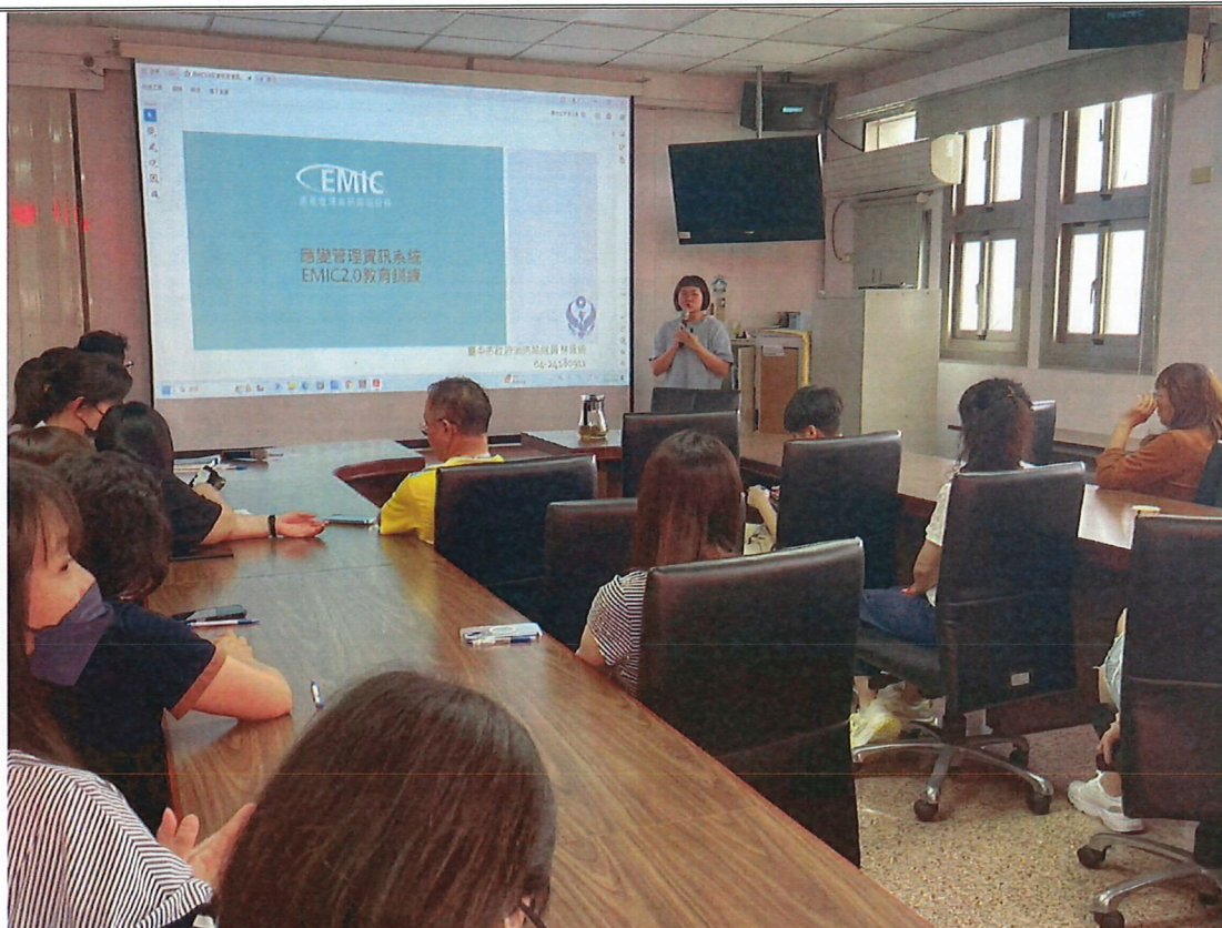
說明 EMIC 系統教育訓練