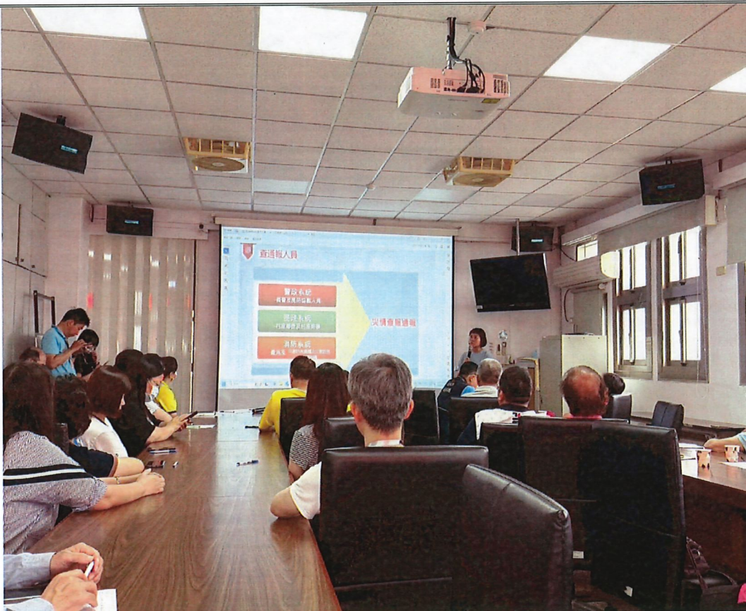
說明 災情查報教育訓練