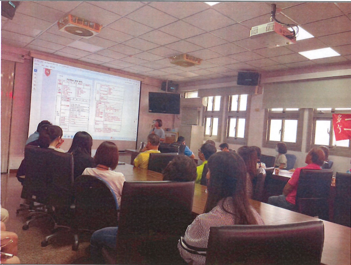
說明 災情查報教育訓練