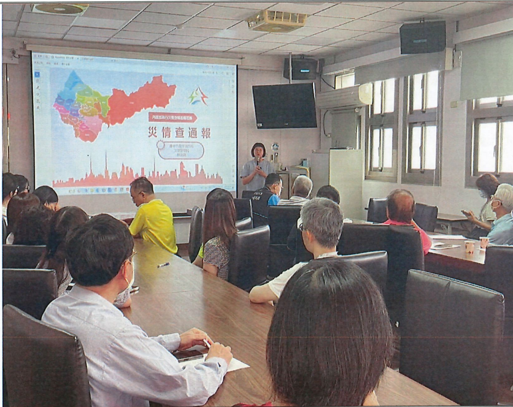
說明 災情查報教育訓練