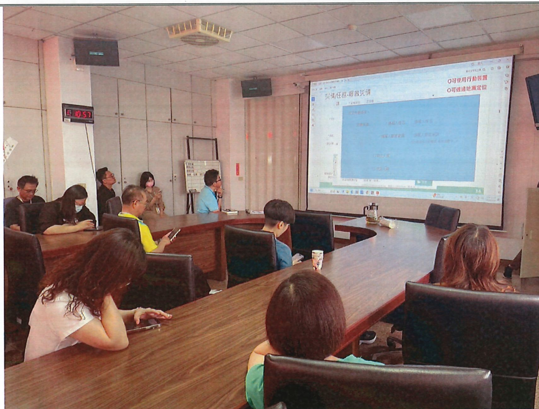
說明 EMIC 系統教育訓練