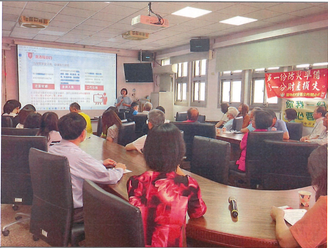
說明 災情查報教育訓練